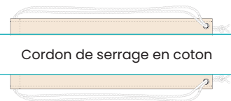
Cordon de serrage en coton

Ces sacs en coton sont pratiques et élégants, et avec un logo d'école ou d'entreprise ou un design de marque, ils prennent vraiment vie.