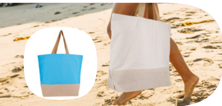
GJCANV12 SAC EN TOILE DE COTON DE QUALITÉ SUPÉRIEURE DE 12 OZ TAILLE: W54.5 X H44.5 X D20 CM

Fabriqué avec une toile de coton hydrofuge de 12 oz, ce sac spacieux de haute qualité avec une base de juco mettra en valeur votre marque haut de gamme avec classe.