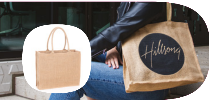
GJ017UL/CS GRAND JUTE BAG NON DOUBLÉ OU ENDUIT D'AMIDON DE MAÏS TAILLE: W42 X H35 X D15 CM

Fabriqué uniquement à partir de jute naturel et est 100% écologique.