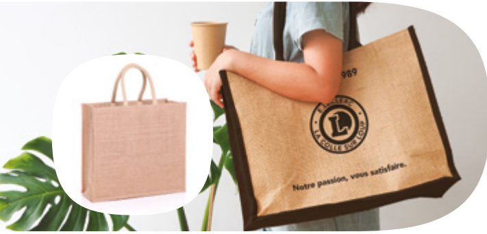
GJ014 GRAND SAC EN JUTE TAILLE: W45 X H40 X D17 CM

Parfait pour faire les achats, ce sac en jute extra large offre beaucoup d'espace pour faire ses courses et pour imprimer votre logo et le message de votre campagne.