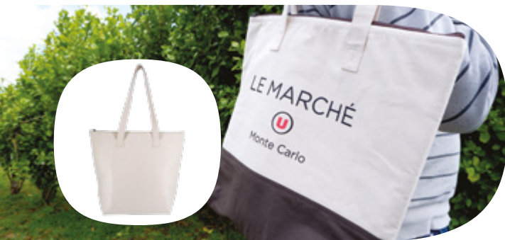
GJCOOL SAC COOL EN COTON TAILLE: W47 X H40 X D15 CM

La doublure intérieure en feuille d'aluminium garde vos aliments frais et réfrigérés, que vous fassiez un voyage à la plage en revenant d'un supermarché.